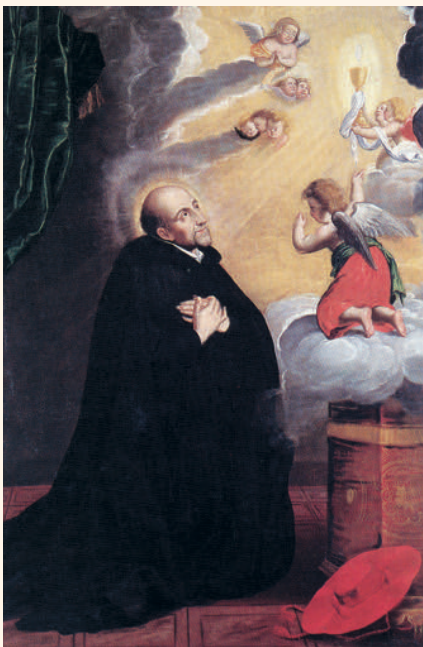
La Mort de St Joseph

Il faut voir dans la peinture de la chapelle la mise en valeur par l'image d'une foi militante.