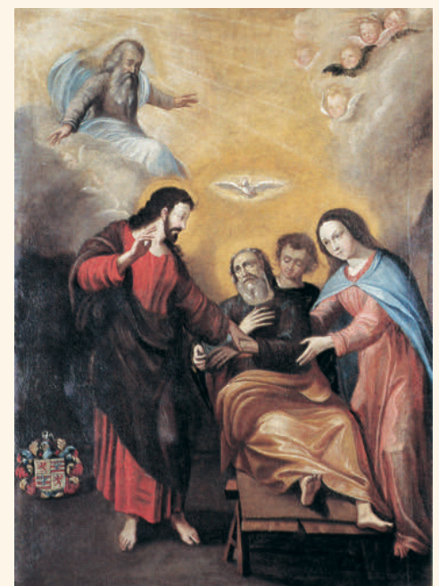
St Ignace en Extase

On y devine le souci permanent de la persuasion et de la conversion.